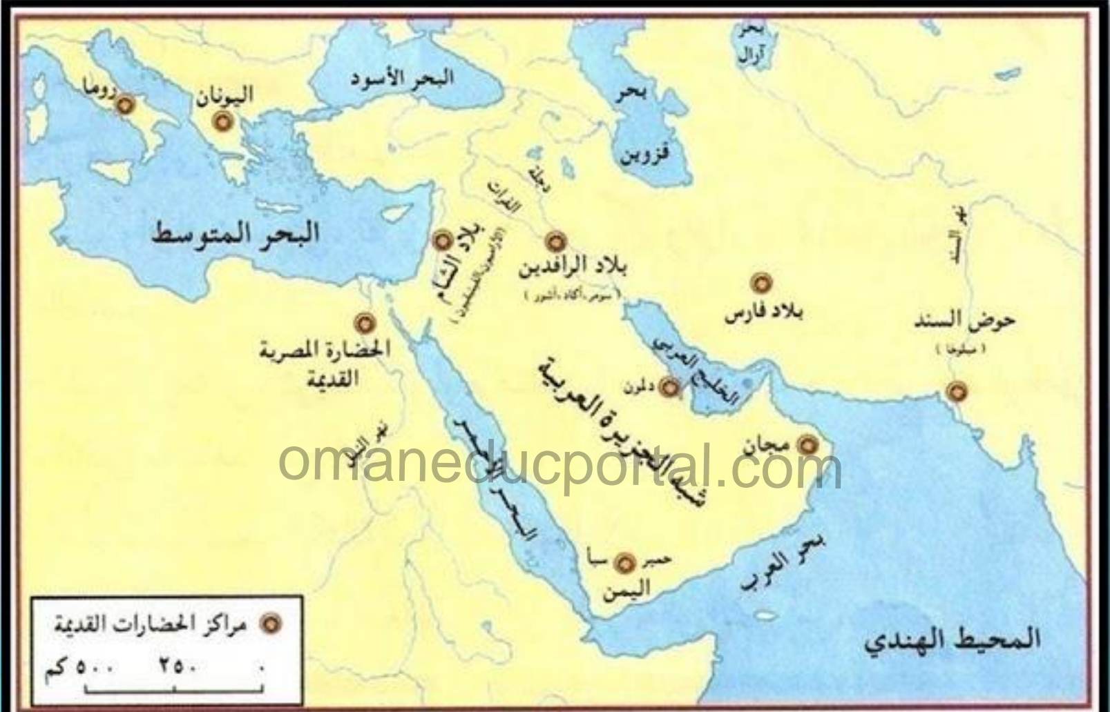
مراکز الحضارات القديمة